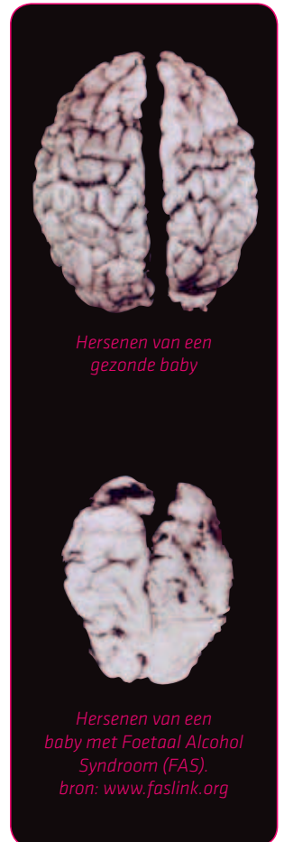
Hersenen van een gezonde baby

Tijdens de zwangerschap worden cellen aangemaakt waarmee lichaamsdelen, hersenen en andere organen groeien. Wanneer je alcohol drinkt tijdens de zwangerschap, kun je de aanmaak van die cellen verstoren. Hierdoor is het mogelijk dat sommige delen van het lichaam van je kindje niet goed groeien. Of je beschadigt organen bij je baby die al ontwikkeld zijn. Vooral de hersenen zijn kwetsbaar: die blijven de gehele zwangerschap in ontwikkeling. Daarom kan alcoholgebruik tijdens ieder moment van de zwangerschap voor hersenschade zorgen. Bij een kind kun je dan afwijkingen zien, zoals een lager IQ, leerproblemen, hyperactiviteit of gedragsproblemen.